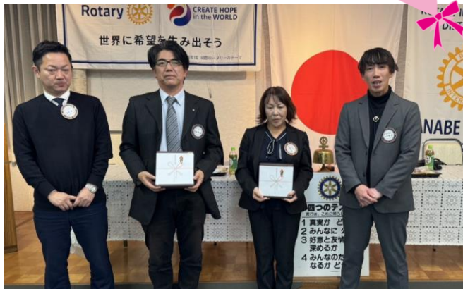
2月結婚記念日 おめでとうございます♪