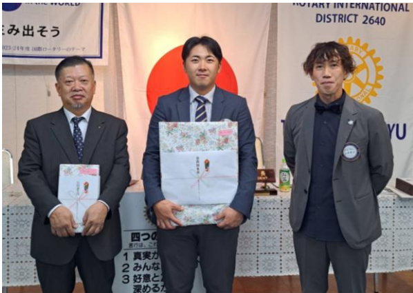
10月・11月 会員誕生日 おめでとうございます♪