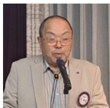
ローターの友 11月号紹介