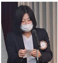
※寄付のご協力ありがとうございました。