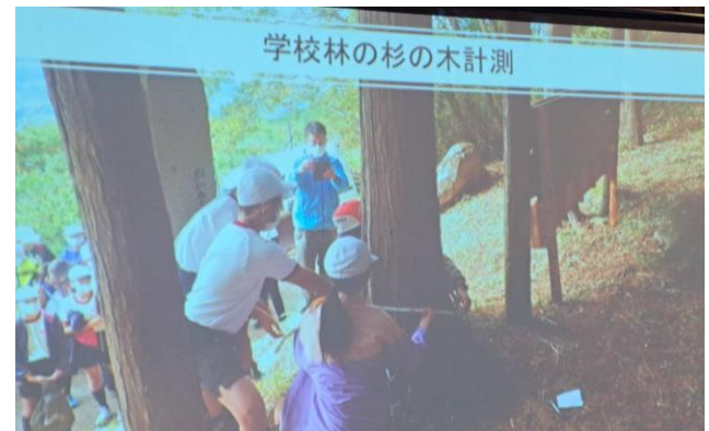
学校林の杉の木計測