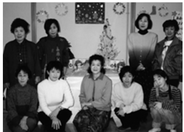
現在のメンバーは10人です。

「楽しいおはなし・こわいおはなし・悲しいおはなし...いろいろな聞いて楽しいですよ。子どもたちがどんな反応で受け入れてくれるのか、楽しみであり、不安でもありませんが、知っている絵本だと、セリフを口にする子どももいて、うれしくなります。紙芝居、パネルシアター、手遊びなども取り入れ、『ここに来ればおもしろいことが待っている』と子どもたちが楽しみにしてくれるような会にしたいと思っています。」