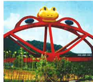
● shioji0913さん、yamahidakaさん、他107人 hidakasanpo 多くの人を招き入れ、町発展への願い