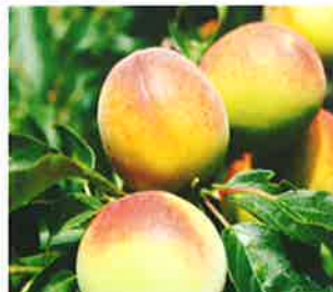
● shioji0913さん、yamahidakaさん、他76人 hidakasanpo 南高梅(なんこううめ)の収穫がみな