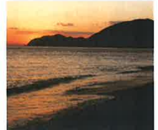
● yamahidakaさん、minabe_tounstAssociationさん、他178人 hidakasanpo 夕陽が美しい海