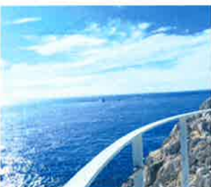
● shioji0913さん、7moomin7さん、他79人 hidakasanpo 豊田の勢向気津う白崎港洋公園