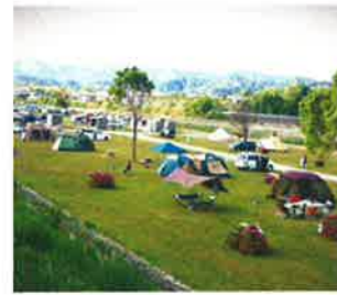
● shioji0913さん、yamahidakaさん、他67人 hidakasanpo 飯坊市内に在る、野口オートキャンプ