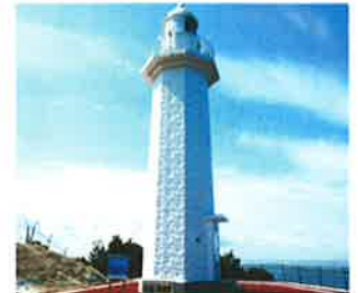
● yamahidakaさん、他85人 hidakasanpo 平成29年3月に立て替えられた紀伊日ノ