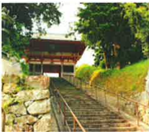
● yamahidakaさん、minabe_tounstAssociationさん、他117人 hidakasanpo 歴史あるお寺の境内の様子