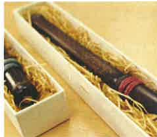
● yamahidakaさん、7moomin7さん、他114人 hidakasanpo 黒竹の里と知られてきた日高町、その