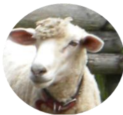
あすなる牧場の ひつじさん