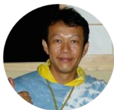
里山キャンプの達人 ポッキーさん