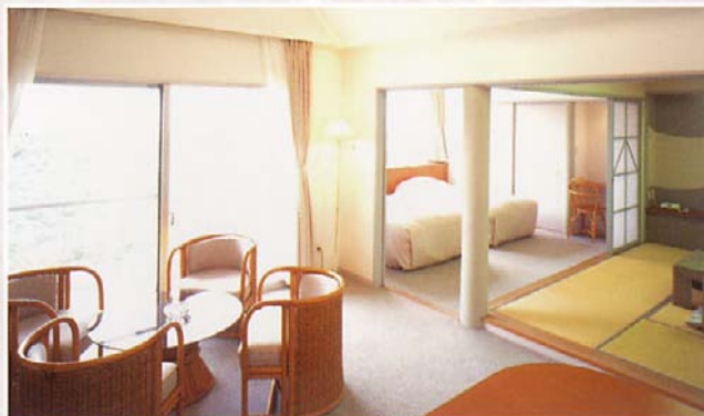
アネックス デラックススイートルーム