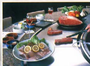
鉄板焼きステーキ