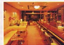
バー・アルバトロス

静かな夜の大人の時間をお過ごしいただけるバーラウンジ。アフターリゾートのお楽しみに、ぜひご利用ください。