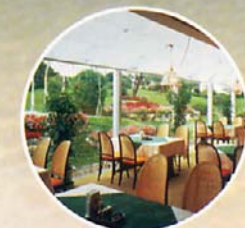
レストラン ポンベッシェ