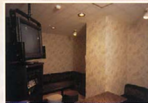
カラオケボックス