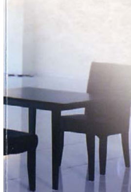
ロビー・ラウンジから