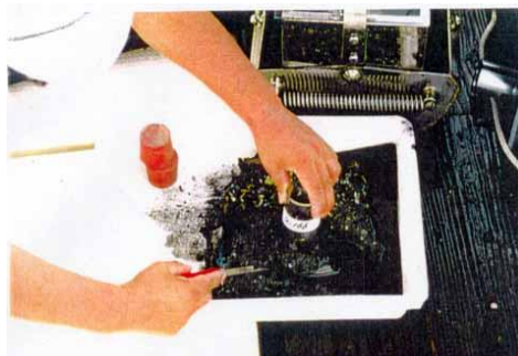
浄化剤を撒布した漁場の底質