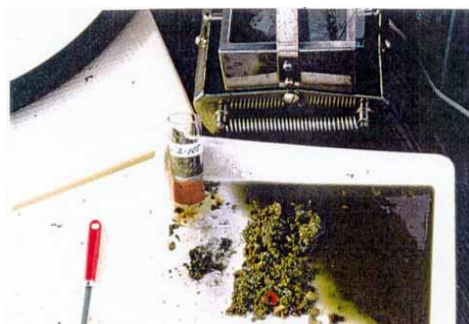
浄化剤を撒布した漁場の底質