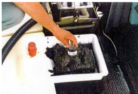
浄化剤を撒布していない漁場の底質