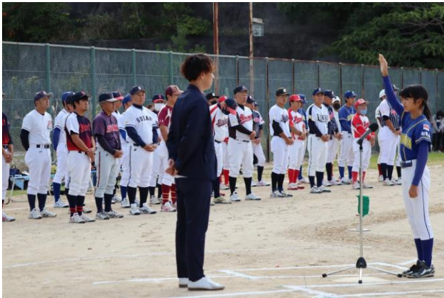
開会式の様子 選手宣誓