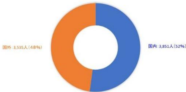
国内外 宿泊者比較 2016/4～2017/8