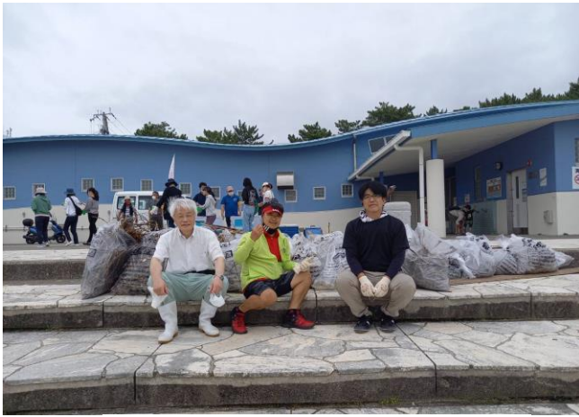
田辺3クラブ合同で写真撮影しました。