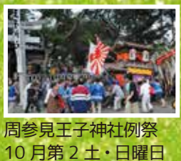
周参見王子神社例祭 10月第2土・日曜日